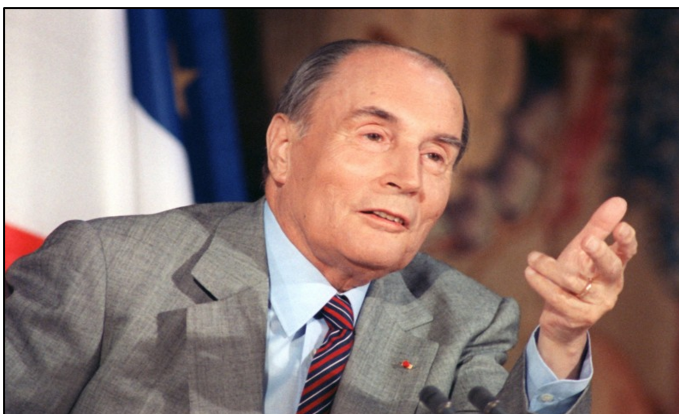
1 ère ALTERANCE FRANÇOIS MITTERRAND PRÉSIDENT