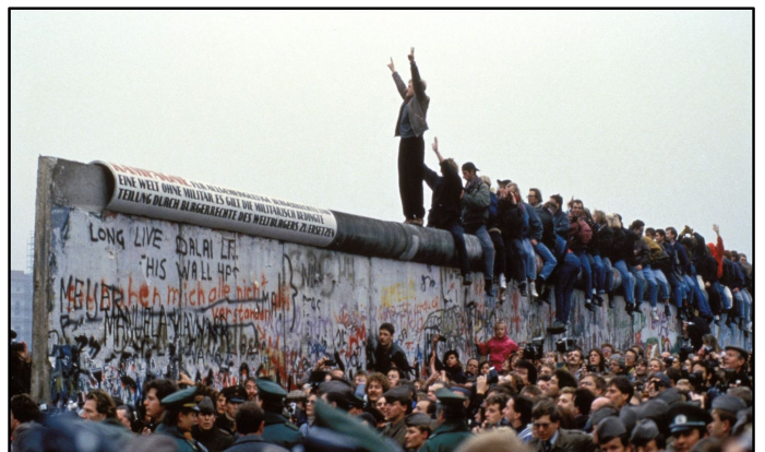
CHUTE DU MUR DE BERLIN