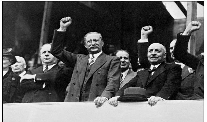
FRONT POPULAIRE EN FRANCE