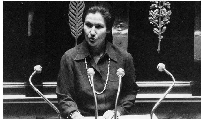
LOI VEIL (IVG)