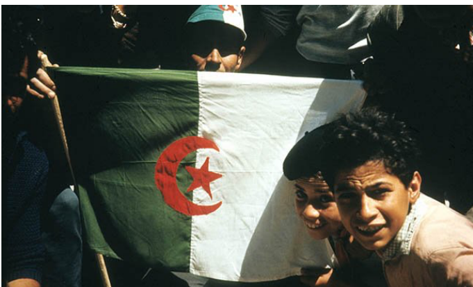
INDÉPENDANCE DE L'ALGÉRIE