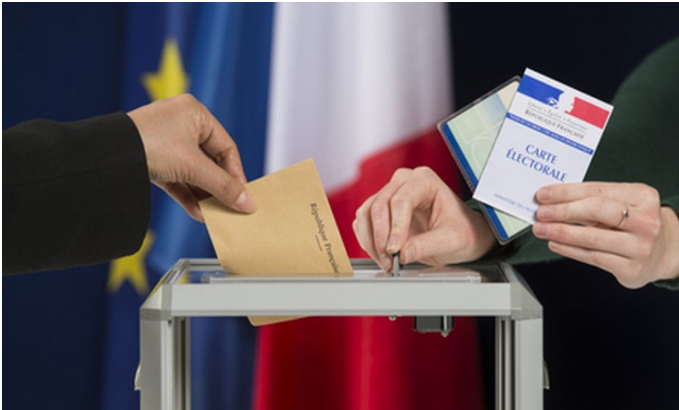
PRÉSIDENT ÉLU AU SU EN FRANCE