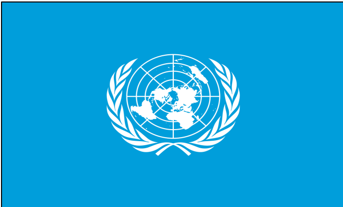
CRÉATION DE L'ONU