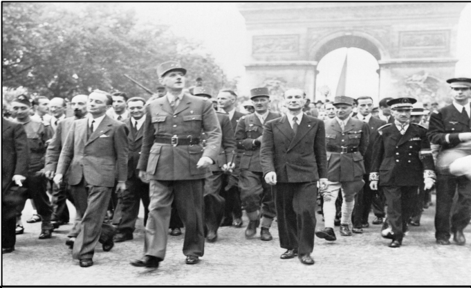
LIBÉRATION ET GPRF