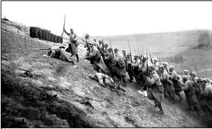
PREMIÈRE GUERRE MONDIALE