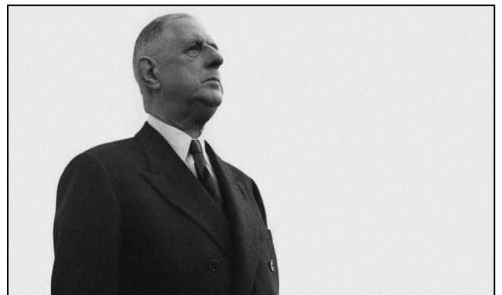
V e RÉPUBLIQUE