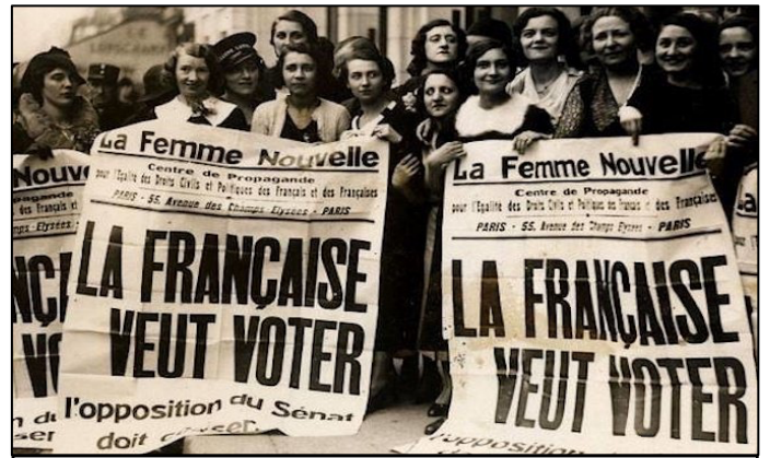
DROIT DE VOTE DES FEMMES