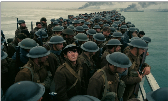
SECONDE GUERRE MONDIALE