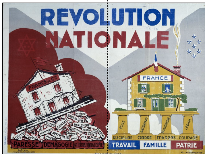
Affiche « Révolution nationale » de René VACHET, entre 1940 et 1942, Musée de l'Armée (Paris).

Composition : l'affiche se divise en deux parties qui s'opposent. D'une part, à gauche, la France de la III e République et, d'autre part, à droite, la France de l'État français.